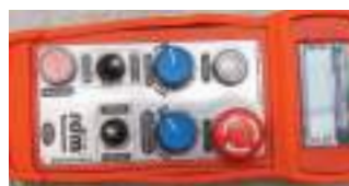
Пульт радиоуправления (Standard version)