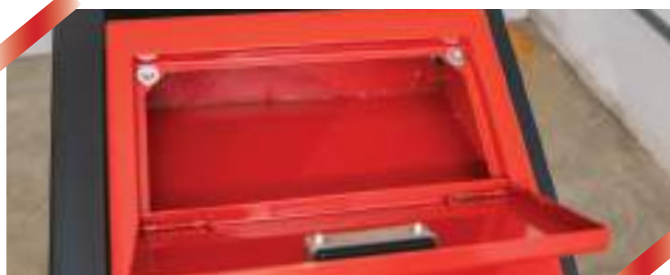
Ниша для телефона и различных мелочей