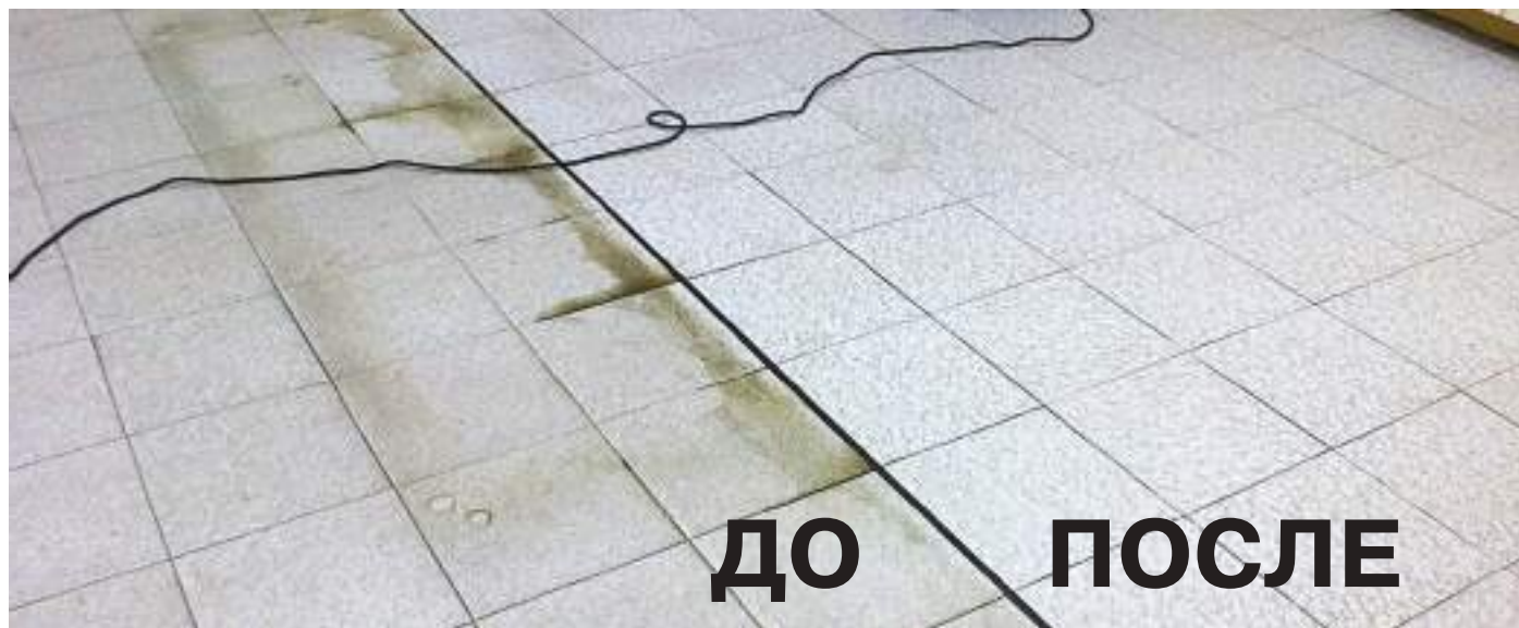
Полировка керамогранитной плитки