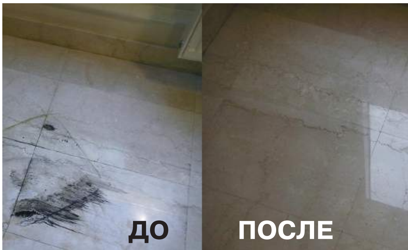
Полировка натурального мрамора