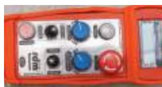
Пульт радиоуправления (Standard version)