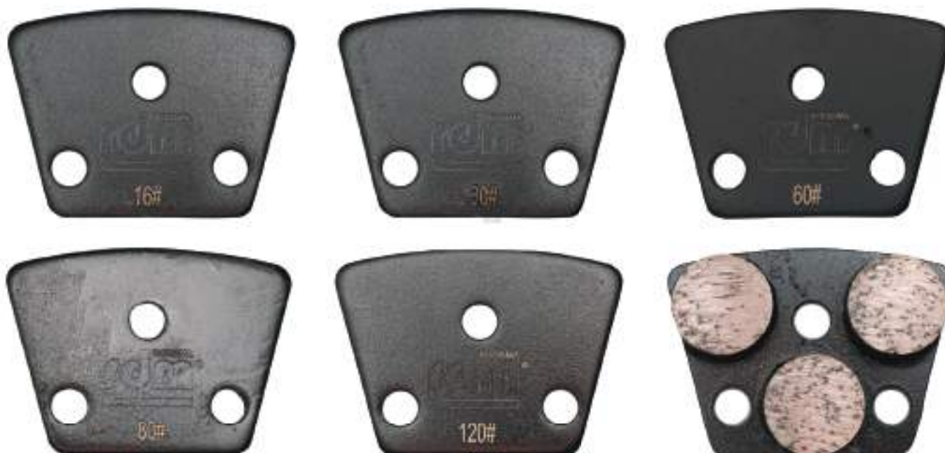
Пады для стандартных бетонов