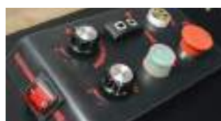
Пульт управления для самоходной машины