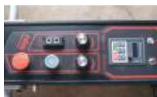
Панель управления с возможностью регулировки частоты вращения шлифовальных дисков от 0 до 1500 об./мин.