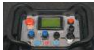
Пульт радиоуправления (High-end version)